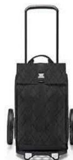
MJ 7059 rhombus black