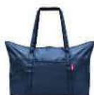
AG 4059 dark blue