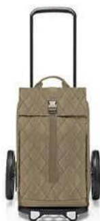
MJ 5046 rhombus olive