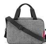
ZK 7052 twist silver