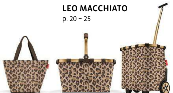
LEO MACCHIATO p. 20 – 25