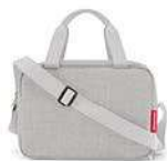
ZK 1035 twist sky rose