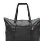
AG 7003 black