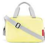
ZK 2035* lemon ice