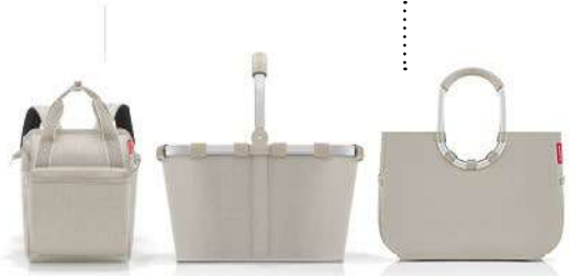
HERRINGBONE SAND p. 32 – 37