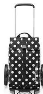
MJ 7073* dots white