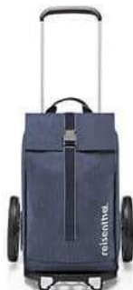
MJ 4113 herringbone dark blue