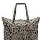
AG 7061 baroque marble