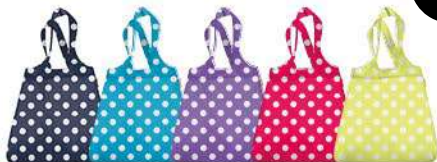
MINI MAXI SHOPPER DISPLAY DOTS WHITE p. 54