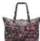
AG 7064 paisley black