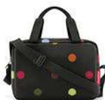
ZK 7009 dots