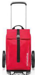
MJ 3004 red

AUSLIEFERUNG/DELIVERY: OKTOBER/OCTOBER 2023