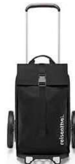
MJ 7003 black