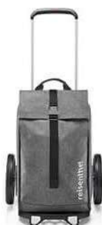
MJ 7052 twist silver