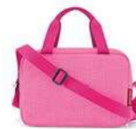
ZK 3094* twist pink