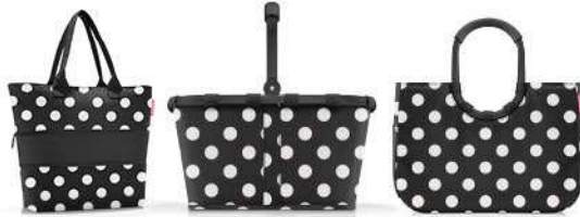
DOTS WHITE p. 6 – 13