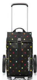
MJ 7009 dots