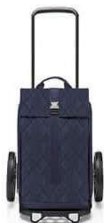
MJ 4110 rhombus midnight

AUSLIEFERUNG/DELIVERY: FEBRUAR/FEBRUARY 2024