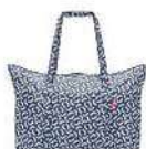
AG 4073 signature navy