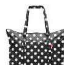
AG 7073 dots white