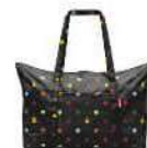
AG 7009 dots