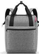
ALLROUNDER R LARGE p. 56