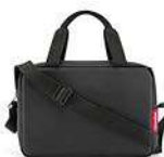
ZK 7003 black